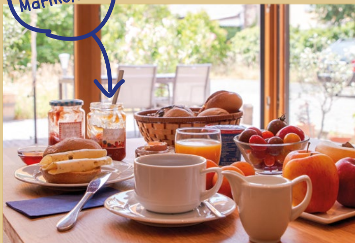
Frühstück mit Blick in den Garten.

Große Ferienwohnung für bis zu vier Personen.